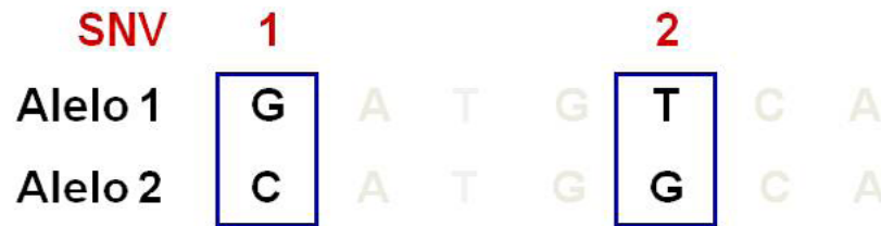
Figura 3. Poliformos de un solo nucleótido.

Anteriormente, se estudiaban fragmentos de ADN y su localización en los diferentes cromosomas por medio de metodologías de hibridación in situ con fluorescencia (FISH). De esta forma era posible señalar cierto fragmento del ADN, conteniendo uno o varios genes, el cual era el causante de una enfermedad, debido a la depleción, duplicación, inversión y translocación cromosómica de dicho fragmento de ADN. Posteriormente, surgió la secuenciación con el método Sanger que consiste en replicar la región del genoma de interés por medio de cebadores específicos y utiliza dideoxinucleótidos marcados radioactivamente que posteriormente evolucionaron a marcaje fluorescente. Estos nucleótidos marcados al ser incorporados en la nueva cadena amplificada, finalizarían la reacción permitiendo conocer el último nucleótido de dicha reacción y establecer la secuencia del ADN. Esta metodología se desarrolló en los la década de 1970 y se acopló a estrategias de secuenciación a gran escala, lo que permitió realizar la secuenciación del genoma humano en 2001; sin embargo, estas metodologías eran muy costosas.