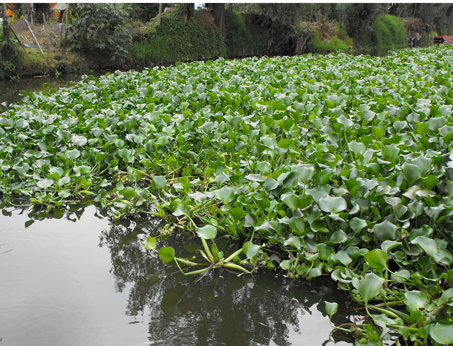
Figura 2. Reproducción descontrolada de lirios acuáticos en los canales de Xochimilco en la CDMX.

Entonces, el riesgo de consumir plantas o animales que bioacumulan sustancias tóxicas dependerá de factores determinados como la cantidad, la concentración y la ruta de exposición. No es lo mismo tocar una planta que consumirla. Si sólo la toco, probablemente tendré urticaria (ronchas y comezón en la piel), mientras que si la consumo puedo acabar en el hospital por intoxicación. No es lo mismo comer pescado una vez a la semana que consumirlo diariamente; cuanto menos organismos bioacumuladores ingiera, menor será el riesgo de afectar mi salud.