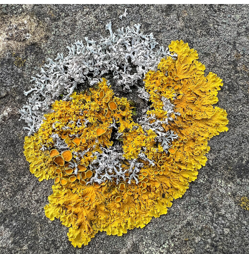
Figura 3. Líquenes bioindicadores de la calidad del aire. La contaminación del aire afecta su supervivencia. Crédito: Green (2024).

Por ejemplo, el lirio acuático que prolifera en los canales de Xochimilco es un indicador claro de la presencia de contaminantes en el agua (Cardinalia, 2020). La presencia cada vez más frecuente de delfines, orcas y ballenas varados en las playas, como menciona Hobson (2021), también puede atribuirse a la presencia de contaminantes en su entorno marino. Estos animales, al enfermarse, suelen salir del mar para morir, siendo los contaminantes como el petróleo derramado o los microplásticos consumidos como basura, algunos de los motivos de estos varamientos.